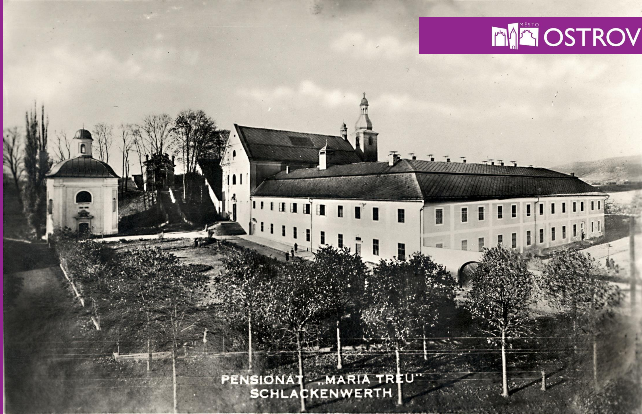
PENSIONAT „MARIA TREU“ SCHLACKENWERTH