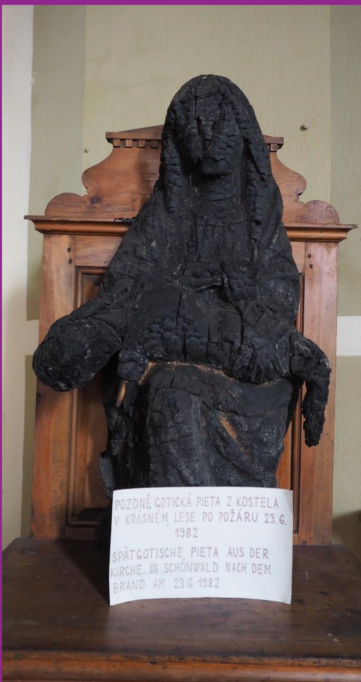
POZDNĚ GOTICKÁ PIETA Z KOSTELA V KRÁSNÉM LESE PO POŽÁRU 23. 6. 1982 SPÄTGOTISCHE PIETA AUS DER KIRCHE IN SCHÖNWALD NACH DEM BRAND AM 23. 6. 1982