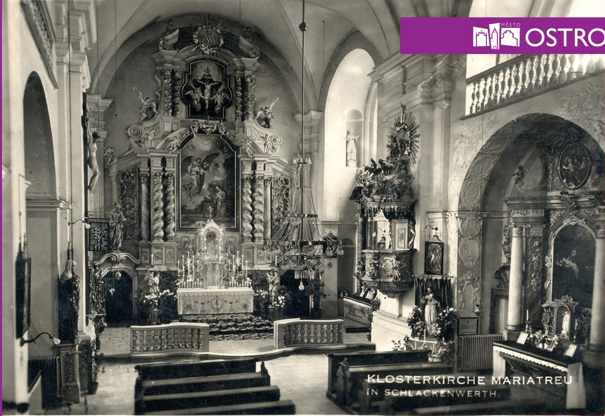
KLOSTERKIRCHE MARIATREU IN SCHLACKENWERTH.