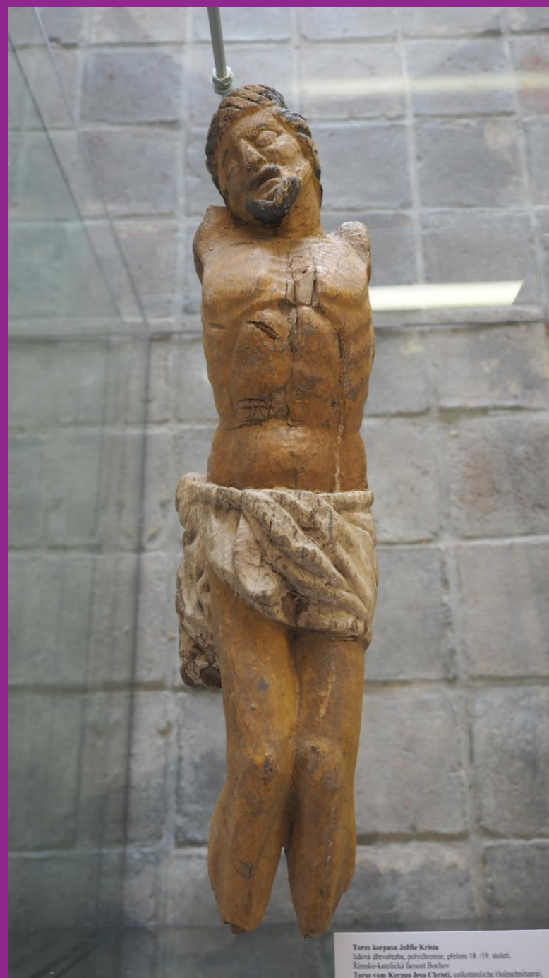
Torzo korpusu Ježíše Krista lidová dřevotěža, polychromna, přelom 18./19. století. Římsko-katolická farnost Bochoř Torso vom Korpus Jesu Christi, volkstümliche Holzschnitzerei,