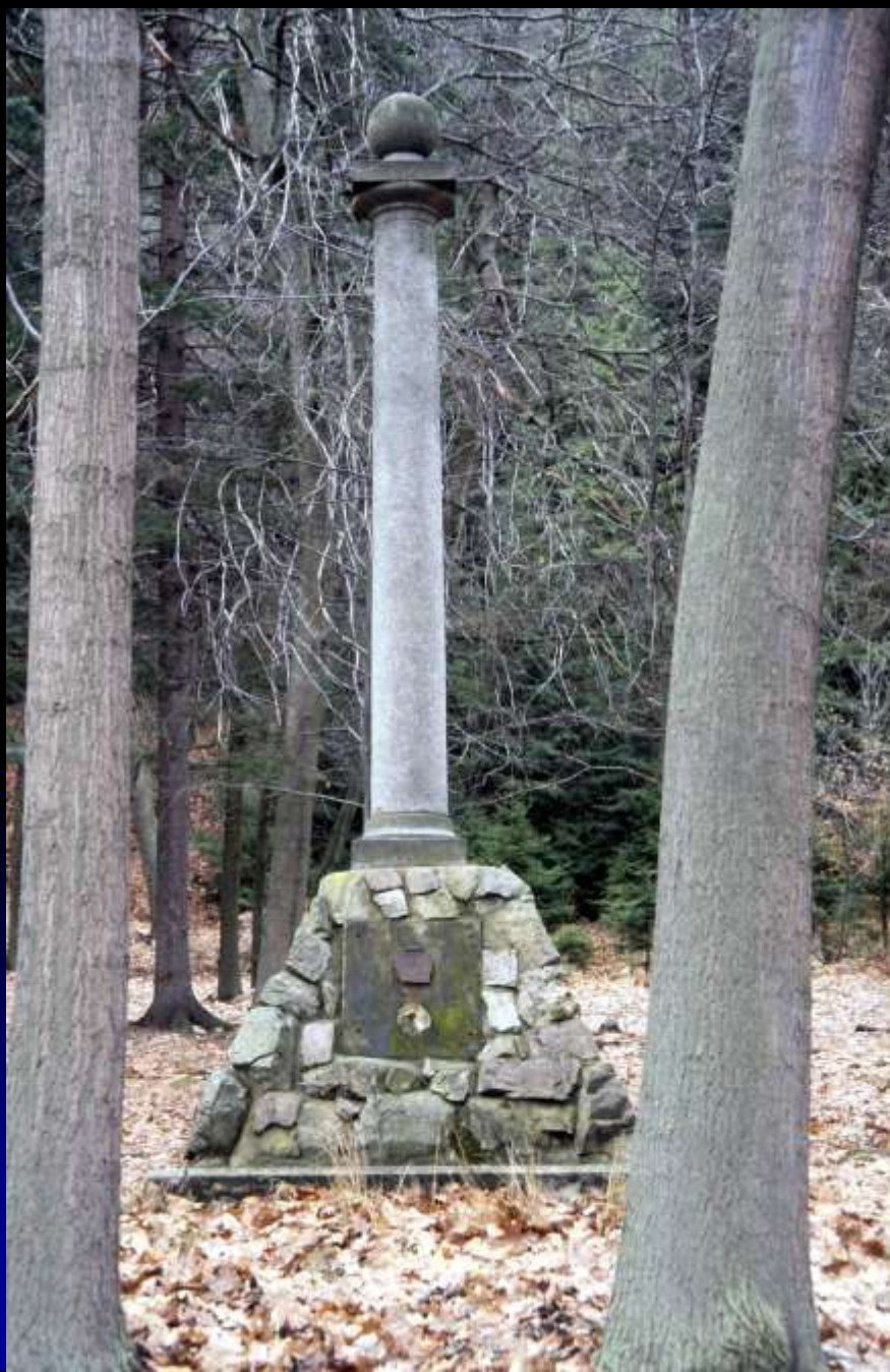
Sloup r. 1874, W r. 1881, celek r. 1932