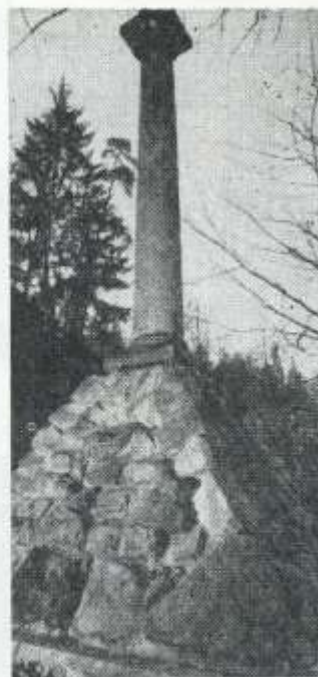
POUP KARLOVARSKÉ- ER CLUBU Z R. 1874 1932 U ODPOLEDNÍ