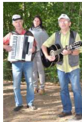
Němečtí muzikanti hráli k radosti všech.