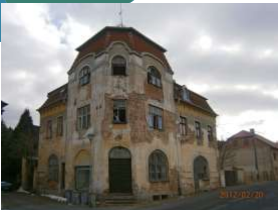
Nečtiny a Karlovy Vary