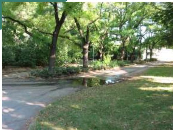
Praha - Vyšehrad a Břevnov