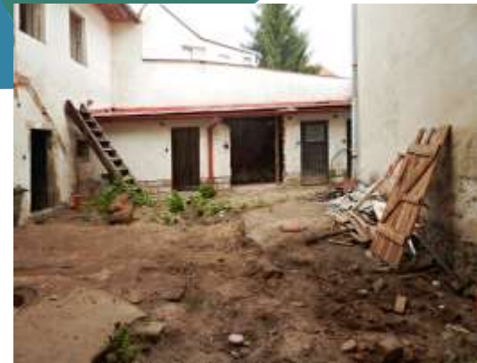
Telč – Nexův dům, Neratovice