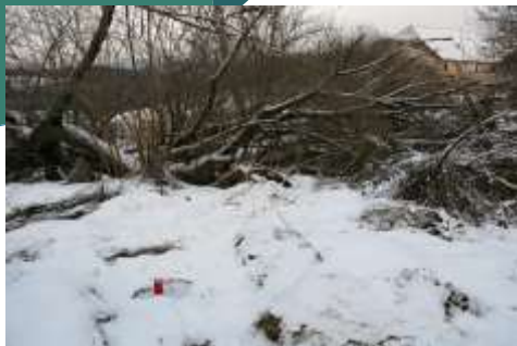
Vatětice a Kříše u Břas, Plz.