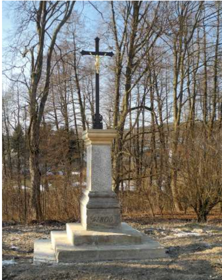
Jablonec - křížky, Tyršova stezka