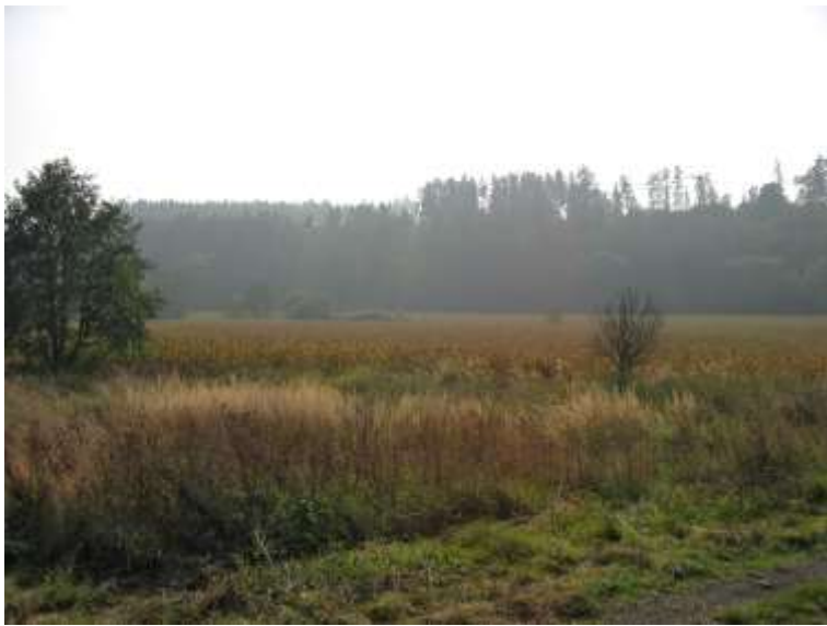
Zbyslavické rybníky, Moravskoslezský kraj