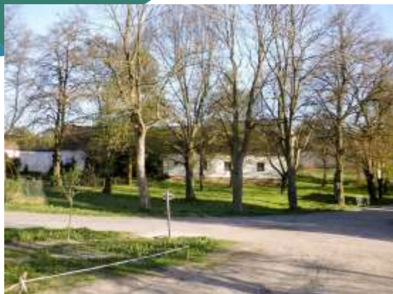
Újezd nade Mží (Plz) a Písek (JČ)